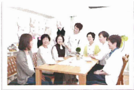
がん患者同士が集う 「茶話会」を定期的に