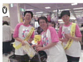
毎月11日は、 イオン日根野にて 「イエローレシート キャンペーン」に参加 活動を伝え、広報活動も。