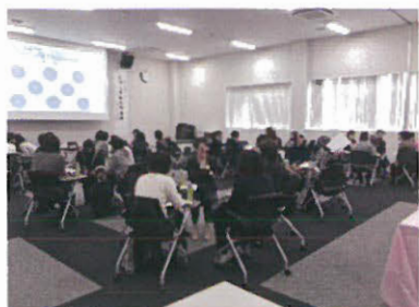
乳がん勉強会、在宅医療、検診啓発など 誰でも参加出来る「市民講座」を開催