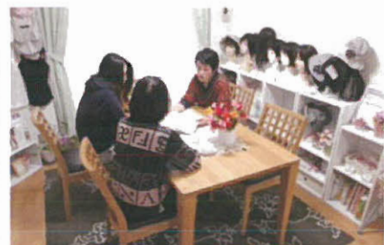
体験者・看護師に「相談」も…