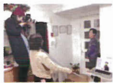
プロのメイクとカメラマンで 「今」を撮る 「美人記念日」を 定期的に開催