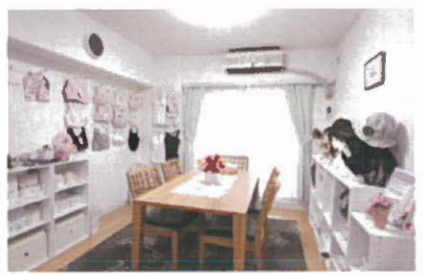
ウィッグ、下着など治療中、その後の生活必需品を 試着、相談できる「ショールーム」