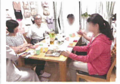
医療や介護の専門職、患者、市民と共に交流、 仕事や生活を通じて、日頃の困り事や生きることを語る 「夜の茶話会」を毎月定期的に開催。