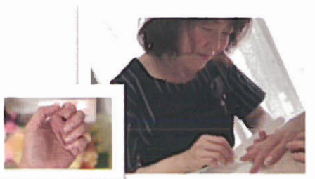
治療や家事で傷んだ爪に保湿と保護を 「ハンドネイルケア」