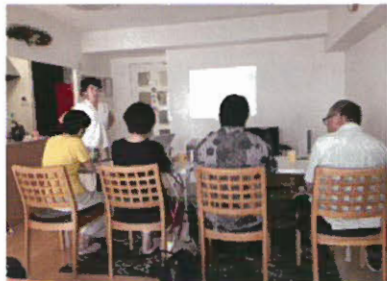
（一社）日本エルダーライフ協会主催 介護者への情報支援を目的とした 「お節介士養成講座」を開催