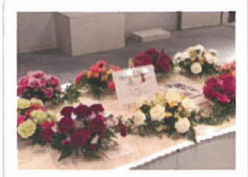
いつからでも始められる 「フラワーアレンジメント」