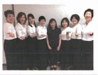
いろんな思いを歌に込めて。 「らふコーラス隊」として、月3回練習